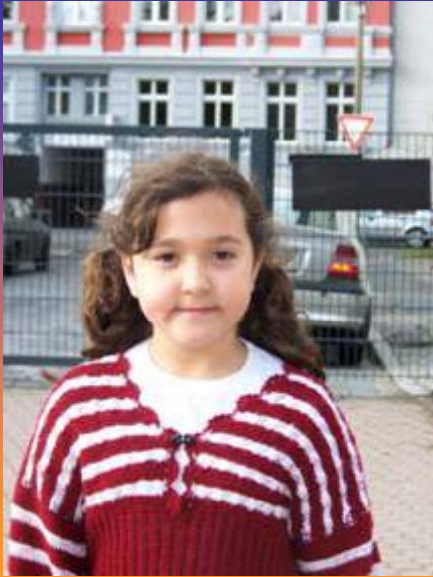
Idea Klasse 3a 7 Jahre